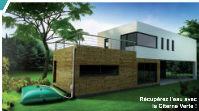
Récupérez l'eau avec la Citerne Verte !

La Citerne Verte est une marque de CITERNEO, fabriquant 100% français spécialisé dans la récupération souple d'eau de pluie.